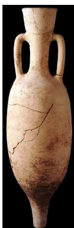
Amphore Pascual 1