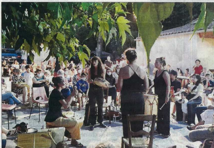
Les quatre chanteuses de «La mal coiffée».

E n ces temps perturbés, on prend un grand plaisir à découvrir ou redécouvrir notre petit patrimoine de proximité: moulins, églises et chapelles sont au programme de notre été de balades en Lauragais. A côté du bâti ancestral, il est un autre patrimoine qui enchante les amoureux d'authenticité: notre belle langue d'Oc. Pour la magnifier, rien de tel qu'un concert de voix féminines tel que celui que nous ont offert les quatre chanteuses du groupe polyphonique «La mal coiffée» vendredi soir sous les mûriers platanes de Villespy: à même le sol, entourées de leur public, telles des troubadours des châteaux d'antan, elles ont offert un magnifique moment de musique et de partage au son des percussions tra-