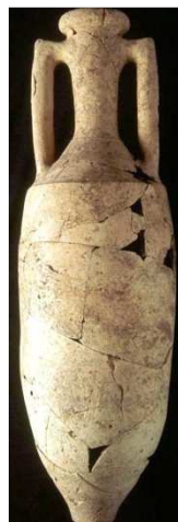
Amphore Dressel 4