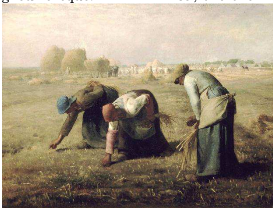
« Glaneuses » - Jean-François Millet

Quoiqu'il en soit, cet épisode nous renseigne sur des pratiques villageoises à la veille de la Révolution. Le glanage qui perdurera bien après-elle, cf. le tableau de Jean-François Millet donné en illustration, est d'un apport conséquent pour bien des foyers. Nous constatons qu'il concerne aussi bien les brassiers, paysans les plus modestes, que les ménagers, possesseurs de terres, ou les artisans et même les « cadres », en la personne de la famille de l'instituteur, à priori plus aisés. L'Histoire parle, à propos de cette époque, de « crise frumentaire », autrement dit de pénurie de blé, notre pays a connu la guerre des farines, au printemps 1775, et beaucoup se souviendront sans doute des parisiennes en manque de pain allant à Versailles, le 5 octobre 1789, chercher « le boulanger, la boulangère et le petit mitron », autrement dit, le roi Louis XVI, la reine Marie-Antoinette et son fils le Dauphin.