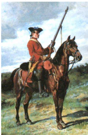
Meissonnier - Un dragon sous Louis XV